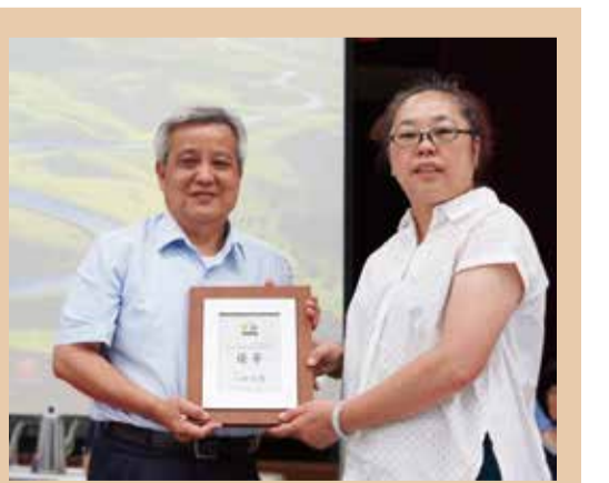
台北市農會107年度農會考核成績經臺北市政府評定為100分，列為優等。