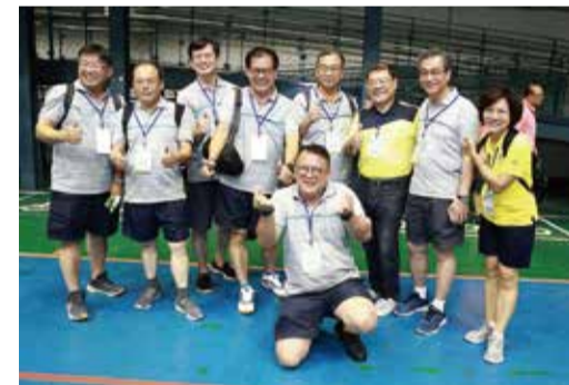
總幹事們參加趣味競賽