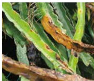
紅龍果莖潰瘍病細部病徵