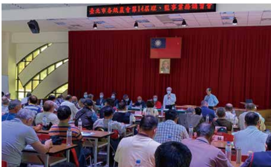
台北市各級農會第14屆理事監事業務講習會

市各級農會新聘人員之考選係依農會法及農會人事管理辦法之規定,於民國66年11月經臺北市政府建設局(現為產業發展局)頒訂「臺北市各級農會聘任人員考選(試)作業要點」後,責由本會辦理統一考選事宜。