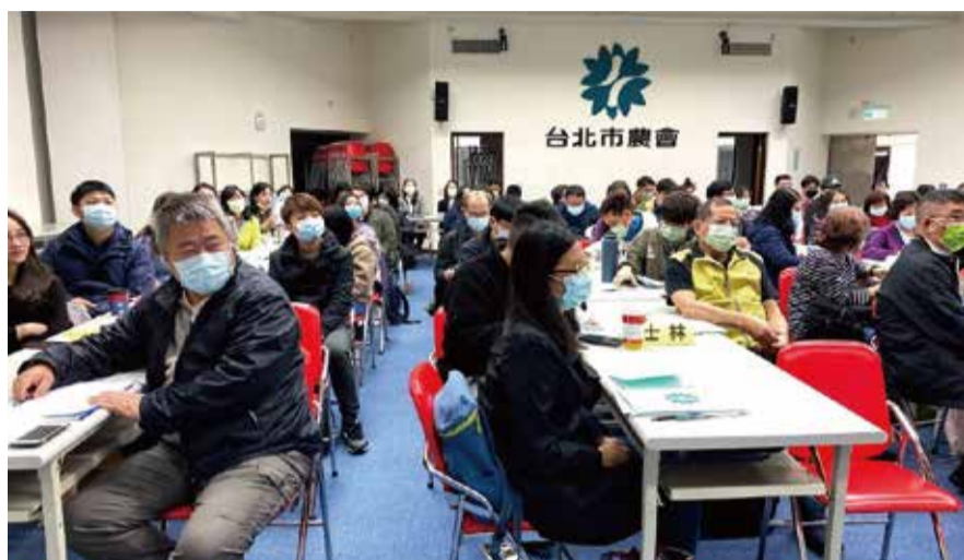
農會選舉投票所選務工作講習

在此特別要提一項在輔導部曾經是重要但目前已消失的業務,就是「辦理臺北市各級農會員工統一考試選拔人才」。農會為執行農會法賦予的任務與開展的各項事業,必須聘僱合格而得以勝任的人員來擔任。同時,在職人員中亦有退休、離職、死亡等情形發生,而衍生之業務量,勢必得增加工作人員。因此,如何選拔適當人才為農會工作,實為農會人事管理中重要的一環。雖然人才的選拔有許多方法,但仍以考選最為公平與客觀。臺北