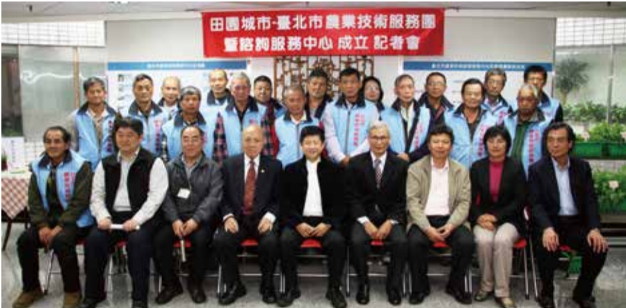
田園城市-臺北市農業技術服務團暨諮詢服務中心成立記者會

民眾種菜遇到問題時，10處農業技術諮詢服務中心，除了可以電話詢問，也可以帶著樣本，就近前往農會尋求協助，也可直接上「台北市農會FB粉絲團」留言。若問題較為複雜或專業，還可以轉介預約農業服務技術團至現場技術指導。