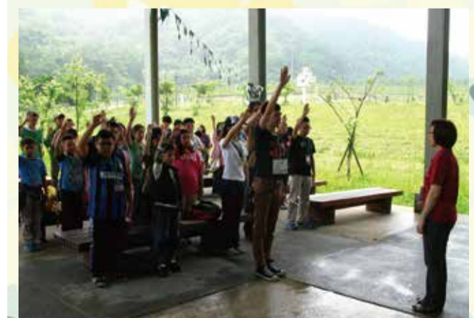
103年大冒險在南港區山豬窟山水綠生態公園舉行

活動內容將配合在地特色搭配總會幹部精心設計各項闖關活動進行體驗，讓各區優秀的四健會員們，可以在闖關活動中互相學習凝聚團結合作精神，發揮手腦身心，進而達到了解臺北市農業發展與各區農會在地農業歷史文化特色，並藉以增加各區四健會會員間的熟識，以達到四健一家親的效果。