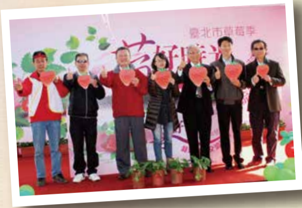
內湖區觀光草莓園開放農戶

《李諭善·臺北報導》台北市農會為再創草莓產業的新榮景，今年特與桃園區農業改良場進行草莓桃園4號技術移轉和品種權簽約，讓臺北市草莓栽培農戶能合法栽種優質的桃園4號草莓。為讓更多的市民大眾認識這外型相當討喜新品種草莓，台北市農會與草莓栽培農戶，於12月6日在臺北花博公園圓山廣場辦理新品種草莓-桃園4號推廣成果發表。