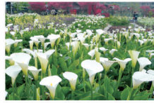
農圃小型音樂會場次表