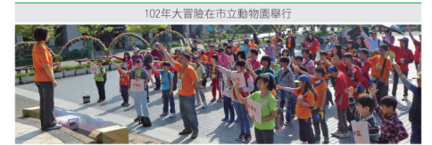
102年大冒險在市立動物園舉行

部精心安排設計了一場拼勁十足的趣味競賽，內容包含體能、團體動力與互助合作，讓四健小朋友們實力的跑跳競賽，也特別結合食農教育的精神，寓教於樂，除了希望四健小朋友能動得健康，更能吃得健康；也讓各區優秀的四健會會員展現活力、綻放光芒，達到凝