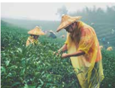
選手採摘茶葉過程

在全場氣氛緊張、心情忐忑下邱副場長揭曉了名單，非常恭喜臺北市代表隊奪下了亞軍的殊榮；此次能在眾多好手雲集、強敵環伺的包圍下，突破重圍奪得此佳績著實不易，此佳績對茶農的採茶功力更有一番肯定，不禁讓人欽佩木柵茶農厚積薄發的實力。