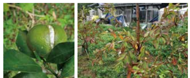
柑橘裂果病徵 番石榴果樹倒伏後葉片褐化病徵

臺北市的農民朋友如於作物栽種上有任何問題，都歡迎與市農會接洽詢問，市農會視作物類別及病況邀請大專院校教授或改良場的專家學者前往訪視診斷給予適當之建議，如有診斷需求，實習植物醫師的連絡電話為(02)2707-0612分機218，農民朋友亦可請臺北市各區農會指導員協助幫忙轉介。