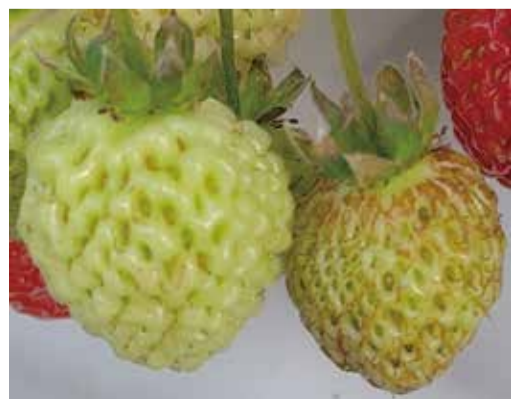
被薊馬危害之草莓果實(右)