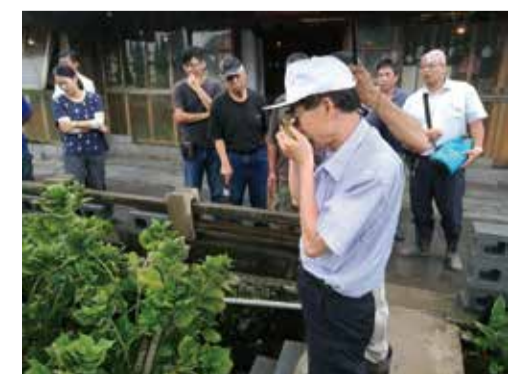
孫教授勸查繡球花之病蟲害

臺北市的農民朋友如於作物栽種上有任何問題，都歡迎與市農會接洽詢問，農會將邀請大學院校教授或改良場的專家學者一同前往訪視診斷給予適當之建議。臺北市實習植物醫師的連絡電話為(02)2707-0612分機218，農民朋友亦可請臺北市各區農會指導員協助幫忙轉介。