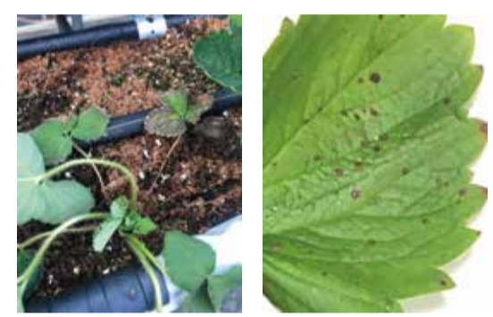
草莓炭疽病感染冠 草莓炭疽病葉部病斑造成倒伏