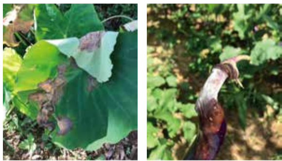
芋頭疫病 茄子腐霉病