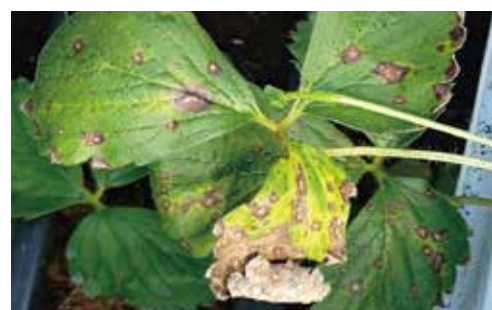
草莓蛇眼病(葉斑病)

重之植株摘除或去除病葉，以免病害擴散，若屬土傳病害(如萎凋病)於田區爆發，建議於草莓季結束後進行土壤消毒殺菌處理避免再度發生。此外，草莓季已悄悄展開，農友於施用各項資材時，請小心施用以避免噴濺到花及果實上產生傷害，並避免施用油劑類資材。