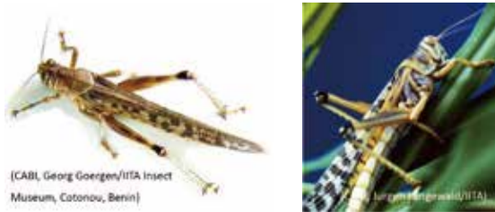
沙漠飛蝗1 防檢局提供資料 沙漠飛蝗2 防檢局提供資料

臺北市的農民朋友如於作物栽種上有任何問題，都歡迎與市農會接洽詢問，市農會視作物類別及病況邀請大學院校教授或改良場的專家學者前往訪視診斷給予適當之建議，如有診斷需求，實習植物醫師的連絡電話為(02)2707-0612分機218，農民朋友亦可請臺北市各區農會指導員協助幫忙轉介。