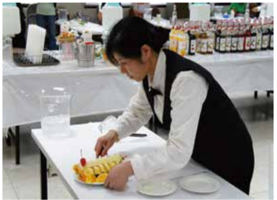
(圖為飲料調製丙級證照班學員模擬考訓練)

報名時間自即日起至9月10日止，符合資格條件者，應至填具報名表二份、身分證影本，向轄屬區農會推廣部辦理報名。每位學員須繳交配合款4,000元，參訓者皆須參加111年飲料調製丙級技能檢定考試，未配合者將追繳全額訓練費用。