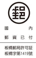
國內郵資已付 板橋郵局特准掛號證明文件 標誌字號1419號

境相對於新穎的士林市場與政府規劃中士林觀光商圈美化的期待，產生了一種新舊落差與對比。 因此台北市政府有意整頓，同意協助改善營業環境及品質，幾經協調，今年6月29日台北市農會第14屆第2次理事會中通過同意於合作期間將「陽明農作物堆集場」交由「台北市市場處」負責營運與經營管理。 希望未來透過政府的輔導與經營管理，能實質提升堆集場的營業環境及品質，讓士林的「大菜市場」轉型為一般的菜市場，繼續為民眾提供優質的服務。