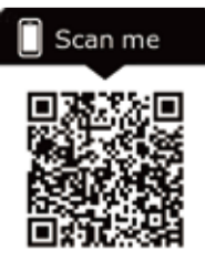
友善農業雜草防除攻略