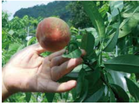
鮮紅粉嫩的水蜜桃果實，就像初生嬰兒的肌膚-白裡透紅、粉嫩嫩嫩的，讓人看了好想咬一口

《邱佩娟·士林報導》士林區農會輔導之觀光水蜜桃園將於5月20日起開放，請民眾踴躍前往採果。士林區之觀光水蜜桃園走精緻管理路線，農家歷經半年以上的辛苦呵護照料，細心剪枝、施肥、套袋，讓果樹結實纍纍，香味濃郁，果肉多汁、入口即化，讓人吃了意猶未盡。