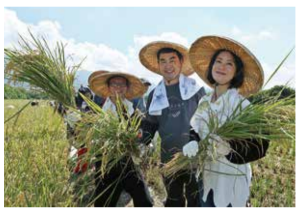
臺北市鄧家基副市長(中)與吳思瑤立委(右一)及潘懷宗議員一同進行割稻體驗

目前關渡平原水稻田皆採用機械化耕作方式，由代耕隊全程從整地、插秧、灌溉、施肥、除草到收割，傳統耕作方式已不復見，藉由水稻文化活動，在夏季舉辦傳統割稻體驗，現場還有割稻傳承表演賽、脫穀碾米體