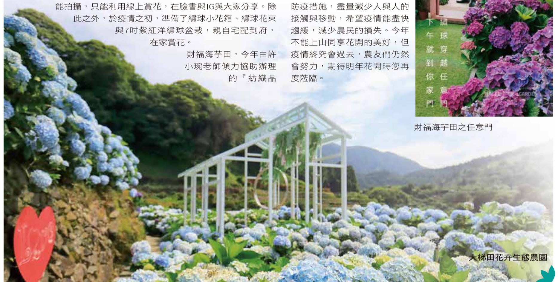
大梯田花卉生態農園