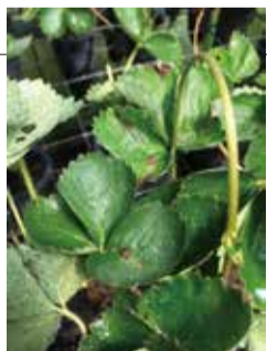
草莓葉部遭受葉枯病危害

台北市的農民朋友如於作物栽種上有任何問題，都歡迎與市農會接洽詢問，市農會視作物類別及病況邀請大專院校教授或改良場的專家學者前往訪視診斷給予適當之建議，如有診斷需求，儲備植物醫師的連絡電話為(02)2707-0612分機218，農民朋友亦可請台北市各區農會指導員協助幫忙轉介。