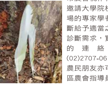
樹木枝條遭鸚鵡咬斷影響光合作用