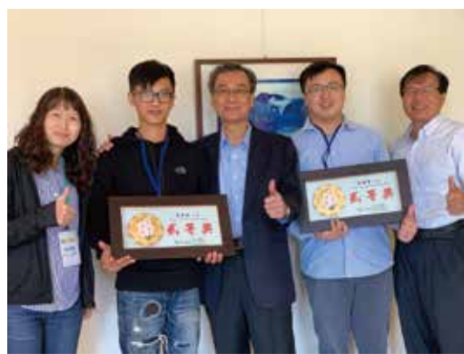
臺北市108年度製茶技術競賽得獎青年農民