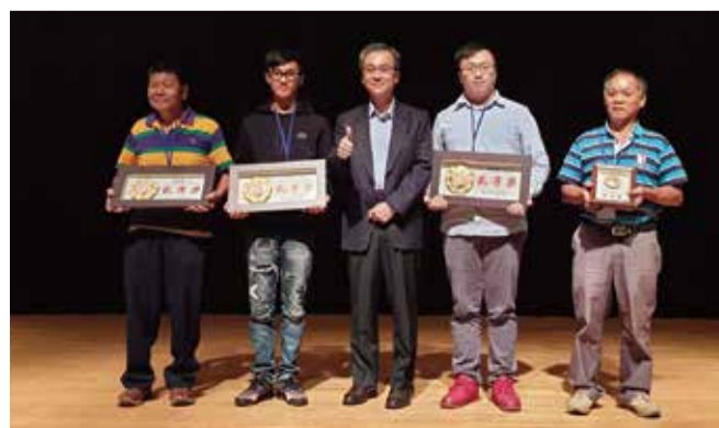
臺北市108年度製茶技術競賽得獎者