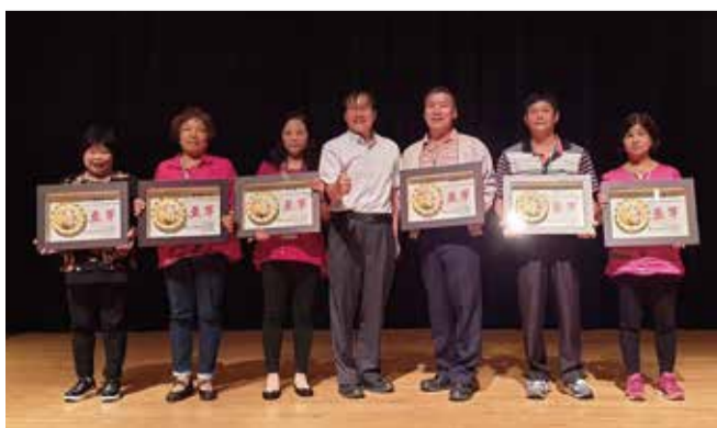
108年全國茶菁採摘技術競賽得獎者

下午的時間則帶領農事研究班幹部們參觀108年桃園農業博覽會，瞭解最新的農業知識及技術，以期能再度提升自身農業技術，生產出更多優質之農產品。